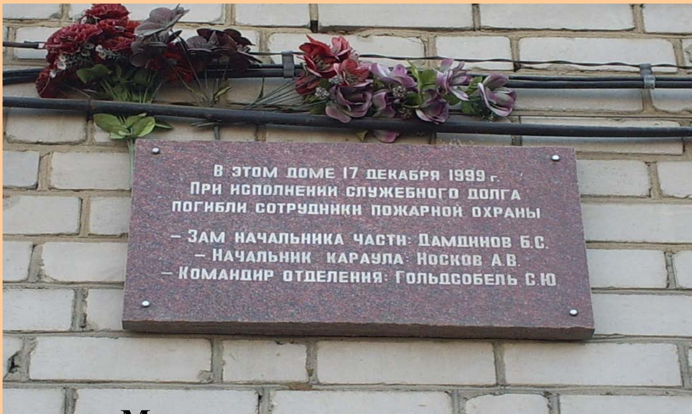
Мемориальная доска на доме по ул. 2-я Верхневокзальная, 16 в г. Чита