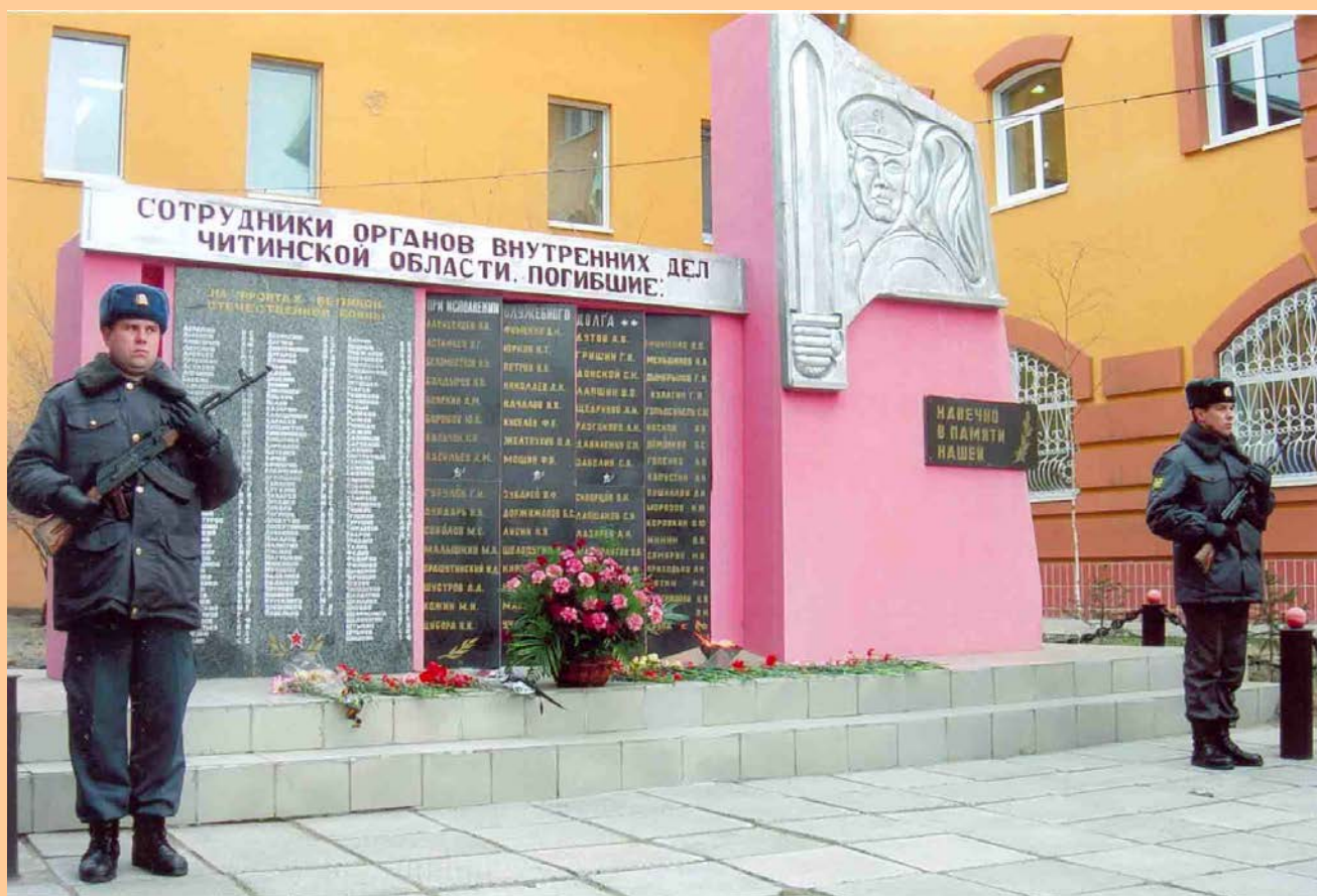
Мемориальный комплекс по ул. Полины Осипенко в г. Чита